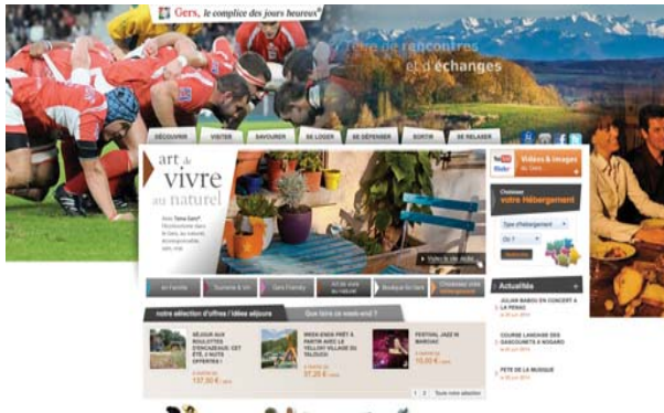
Les films du Gers, complices des jours heureux :