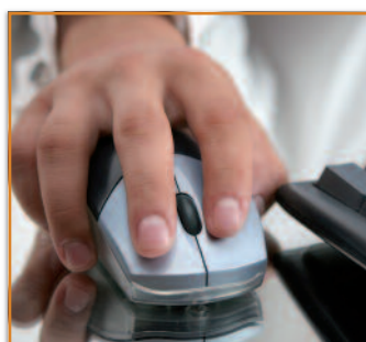
Le bilan d'exécution FSE