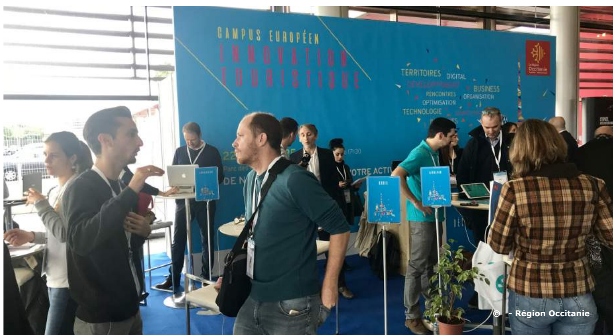
Open Tourisme Lab et ses 10 start-up ont participé au Campus européen de l'innovation touristique organisé par la Région le 22 novembre 2018