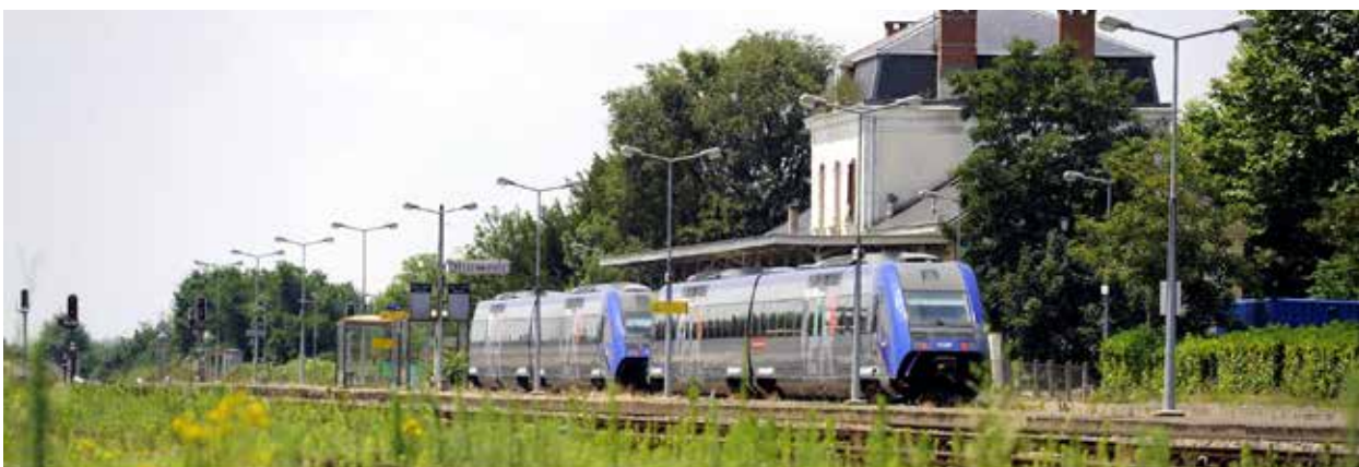
Grimault Emmanuel - Région Occitanie

Portée par la Communauté d'Agglomération de Castres-Mazamet, la réalisation du PEM a été soutenue à hauteur de 1,56 M€ par la Région (40%) et de 774 000€ par l'Etat (19,7 %€), sur un coût global de 4,6 M€.