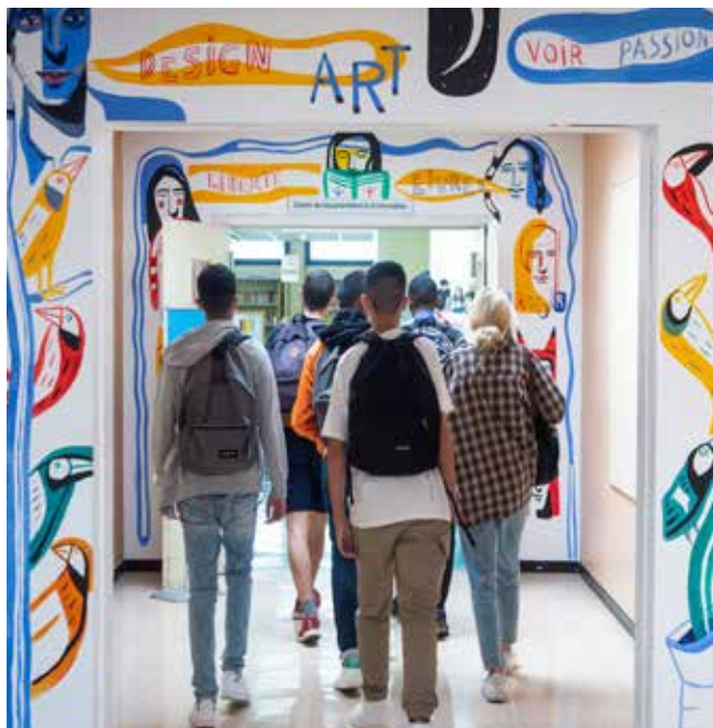
© Grimault Emmanuel - Région Occitanie