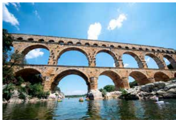
Boutonnet Laurent - Région Occitanie

Parmi les sites d'exception présents dans le périmètre du Grand Site, plusieurs enregistrent plus de 100 000 entrées par an et sont à ce titre de véritables moteurs pour l'attractivité et le dynamisme économique de tout un territoire. Parmi eux on retrouve notamment le Pont du Gard, les Arènes de Nîmes, la Maison carrée et le Musée de la romanité de Nîmes.