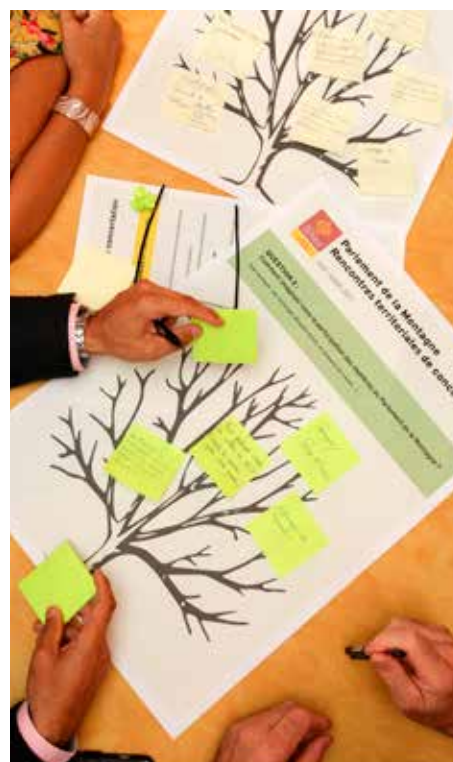
Scheiber Frédéric - Région Occ

Les comptes-rendus des réunions de concertation sont à consulter sur le site internet de la Région Occitanie / Pyrénées-Méditerranée : www.laregion.fr/Le-Parlement-de-la-Montagne