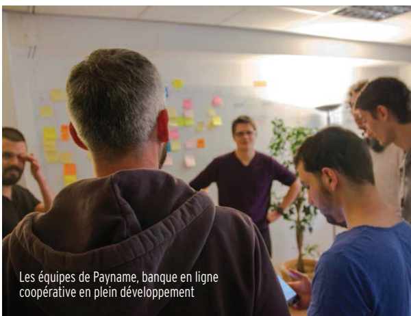
Les équipes de Payname, banque en ligne coopérative en plein développement

Depuis mai 2014, Wineadvisor développe une application mobile sociale autour du vin. Elle permet aux utilisateurs, amateurs ou professionnels, de partager leurs coups de cœur mais aussi d'accéder aux fiches techniques des bouteilles dégustées à partir d'une simple photographie de leur étiquette, et également de commander. Basée à Perpignan, cette start-up emploie 11 personnes et a reçu l'an passé une aide de la Région de 165 000 euros pour se développer. En 2015, cette application est montée sur la première marche des applications sur le vin les plus téléchargées en France.