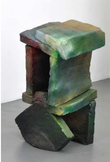
Guillaume Leblon, Chariot , 2012. Céramique et peinture, 70 x 45 x 35 cm.