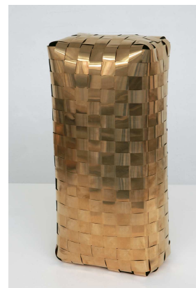
Guillaume Leblon, Chrysocale # 3 , 2005. Cuivre, étain et zinc, 50 x 23 x 16 cm. Collection privée.