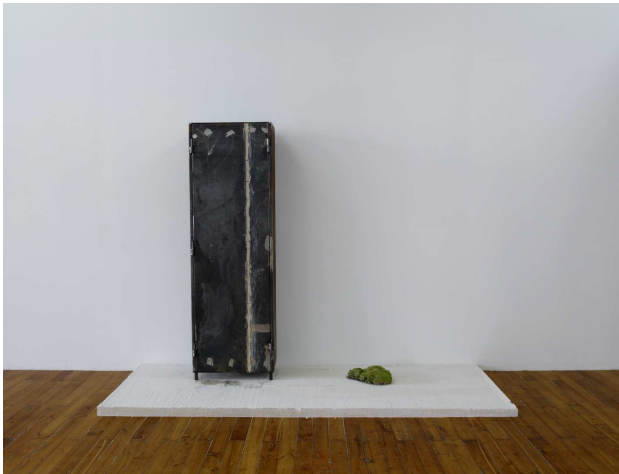
Guillaume Leblon, Vestiaire , 2010. Métal, mousse, argile, ..., 155 x 49 x 30 cm. Vue d'exposition Someone knows better than me, Grand Café, Saint-Nazaire, 2010.