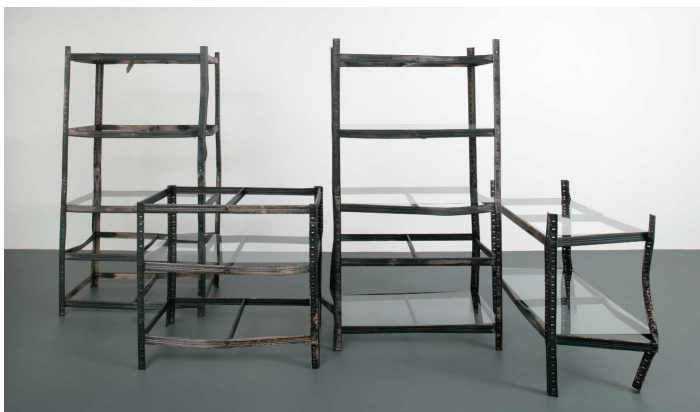
Guillaume Leblon, Set of shelves , 2007. Métal et miroir, 178.5 x 90 x 50 cm, 89 x 90 x 50 cm, 89 x 94 x 52 cm.