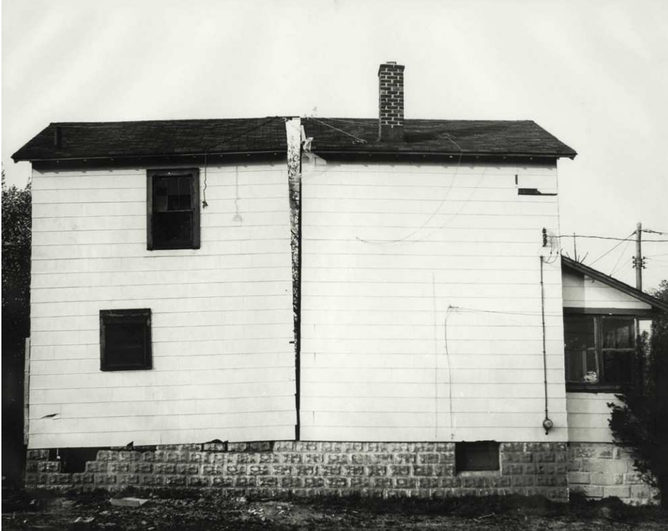
Gordon Matta Clark, Splitting , 1974. Film 54 min. Collection Centre Georges Pompidou, Musée National d'Art Moderne, Paris.

Fils du peintre surréaliste Roberto Matta, étudiant en architecture à l'université de Cornwell, Gordon Matta-Clark est connu pour ses interventions qui ont radicalement altéré des bâtiments existants, pour la plupart des immeubles ou maisons abandonnés, dans les années soixante-dix. Avec ses découpes opérées sur l'architecture, structurant l'espace non par ses pleins mais par ses vides, il réoriente la pensée et la perception. Son œuvre n'aura de cesse de dénoncer les théories classiques et conventionnelles de l'architecture, rejetant les principes de fonctionnalité et d'ornementation et préférant la confrontation directe de l'artiste au bâtiment envisagé alors comme objet.