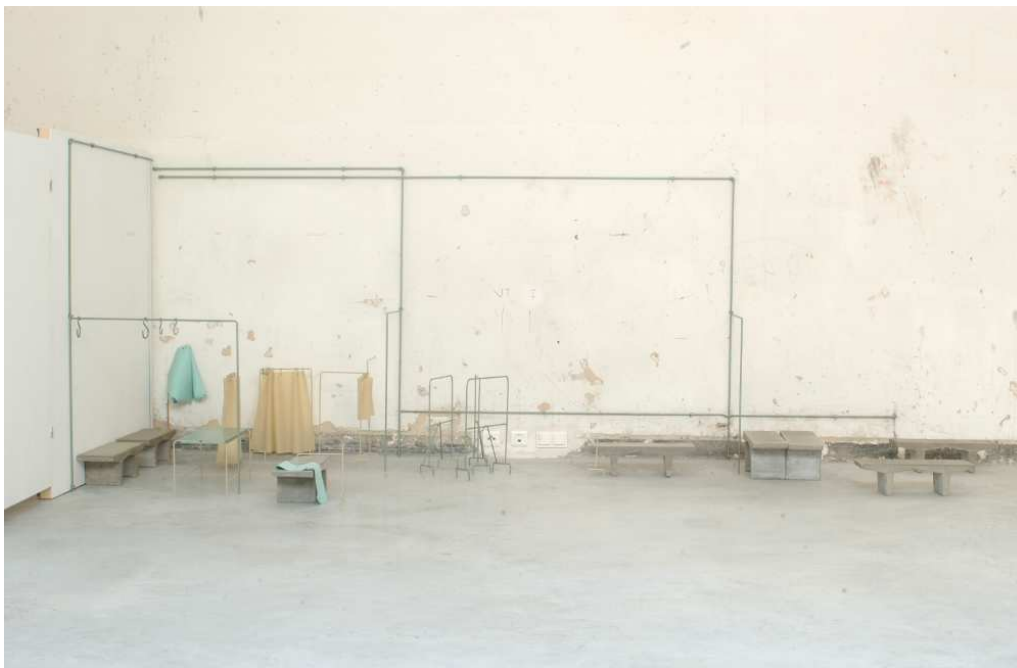
Tatiana Trouvé, Polder , 2002. Environnement, ciment, fer, silicone, plastique, 150 x 340 x 140 cm. Collection du Fonds régional d'art contemporain Île-de-France, France. © adagp.