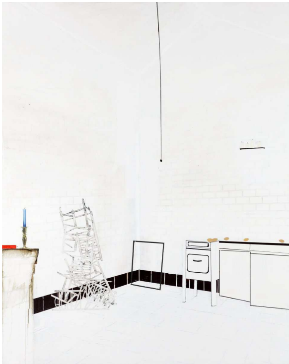
Farah Atassi, Soup Kitchen , 2010. Huile sur toile, 200 x 160 cm. Collection privée. Courtesy Galerie Xippas.