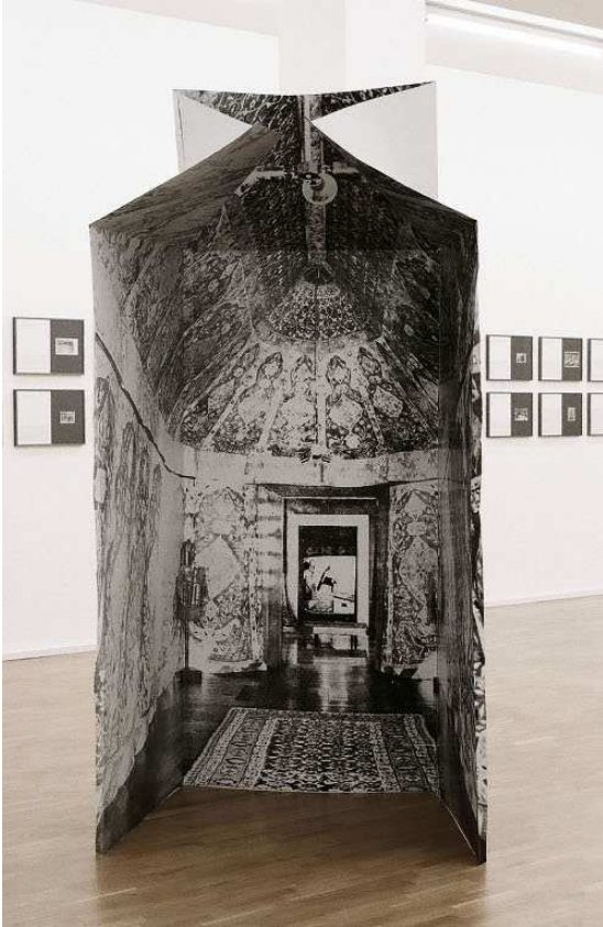
Alexandra Leykauf, Zeit , 2012. Sérigraphie sur aluminium, 225 x 90 x 90 cm. Vue de l'exposition « Lieber Aby Warburg, was tun mit den Bildern? », Museum für Gegenwartskunst Siegen, 2012.

Sa démarche repose notamment sur l'utilisation d'images trouvées qu'elle photocopie ou photographie. Les procédés employés par l'artiste, tels que le miroir, le prisme ou même le pli, viennent perturber l'image, la reconstruire, opérant des changements de points de vue ou de perspectives. Ces techniques mettent en évidence la re-photographie et la construction scénique de ses compositions. Ces images à la fois belles et inquiétantes, mises en scène comme dans un dispositif théâtral, proposent une expérience sensible au spectateur.