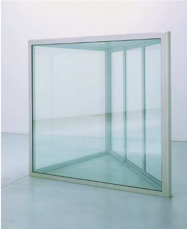
Dan Graham, Triangle Pavilion , 1987. Aluminium, verre, 225 x 245 x 343 cm. Collection Frac Bourgogne.

Artiste conceptuel, théoricien, photographe, vidéaste et architecte américain, Dan Graham puise son inspiration aussi bien dans le contexte politique que social et culturel. Influencé par les artistes de l'art minimal comme Donald Judd ou Sol Le Witt, ses recherches se portent sur la définition d'une œuvre d'art et l'affirmation de la primauté de l'idée sur la réalisation. Travaux conceptuels, performances en écho au body art, films expérimentaux, photographies, interventions dans les pages de magazines, installations jouant de miroirs et de projections vidéos, structures pavillonnaires, écrits critiques : Dan Graham s'impose comme un créateur protéiforme qui interroge les mécanismes de l'art.