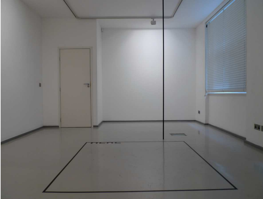
Peter Downsbrough, HERE , 2012. © Peter Downsbrough & Artists Rights Society (ARS), New York.

Architecte de formation, Peter Downsbrough poursuit une réflexion sur le langage et l'espace construit depuis le milieu des années soixante. Héritier des minimalistes, il mène une recherche très personnelle et d'une constance rigoureuse qui marque de ses empreintes un espace devenu banal et habituel. Ses nombreuses pratiques artistiques – sculptures, photographies, pièces murales, livres, films, pièces sonores, interventions dans l'espace urbain – sont fondées sur la notion de position, de séquence, d'intervalle et de cadrage et interrogent le point de vue. La combinaison des éléments linguistiques et géométriques formalise ainsi des espaces structurés induisant une multiplicité de lectures.