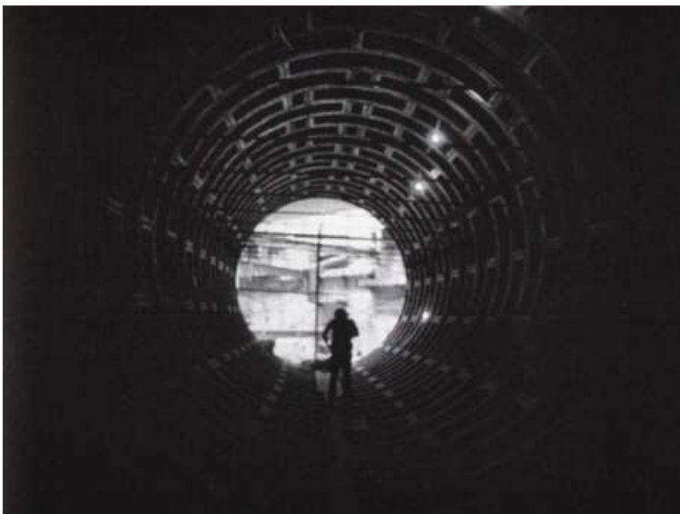
Gordon Matta Clark, Sous-sol de Paris , 1977. Film 25 min. Collection Centre Georges Pompidou, Musée National d'Art Moderne, Paris.