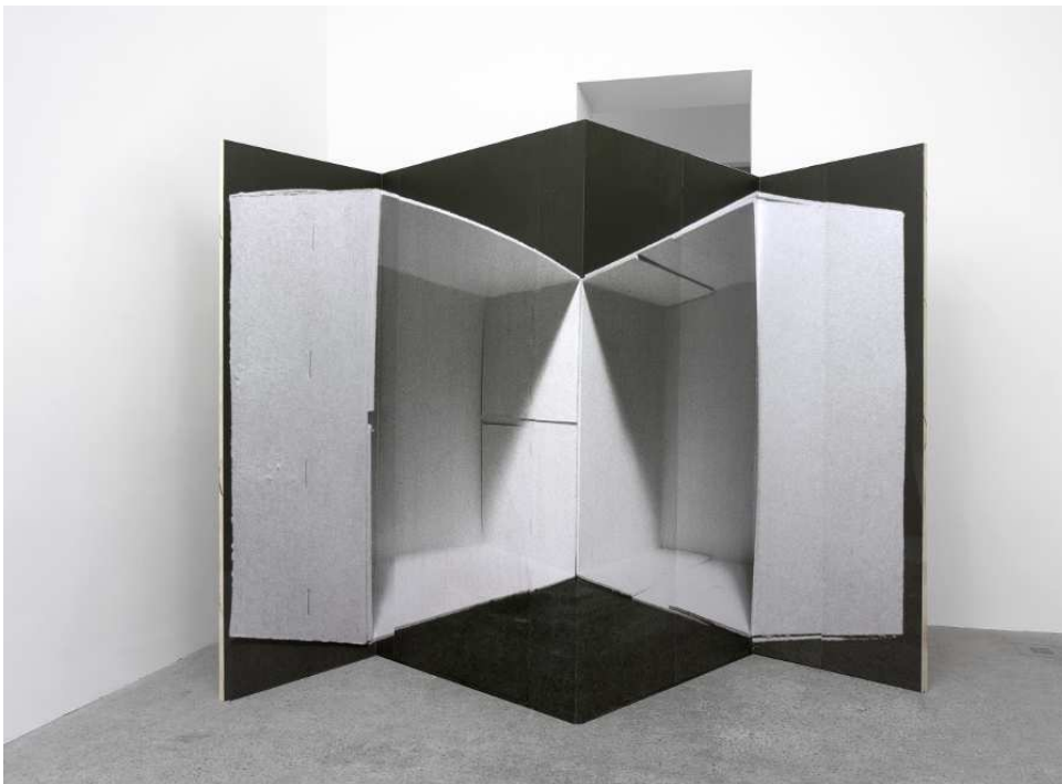
Alexandra Leykauf, Spanische Wand , 2012. Impression noir et blanc sur bois, 215 x 286 cm. Vue de l'exposition « Heart of Chambers », Sassa Trülzsch, Berlin, 2012.