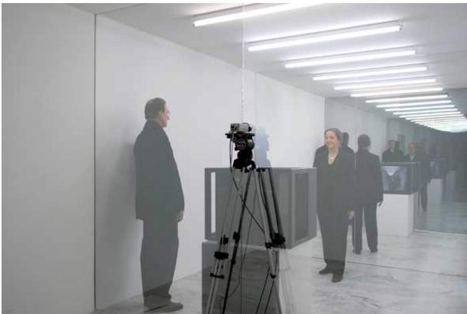
Dan Graham, Two Viewing rooms , 1975. Installation.