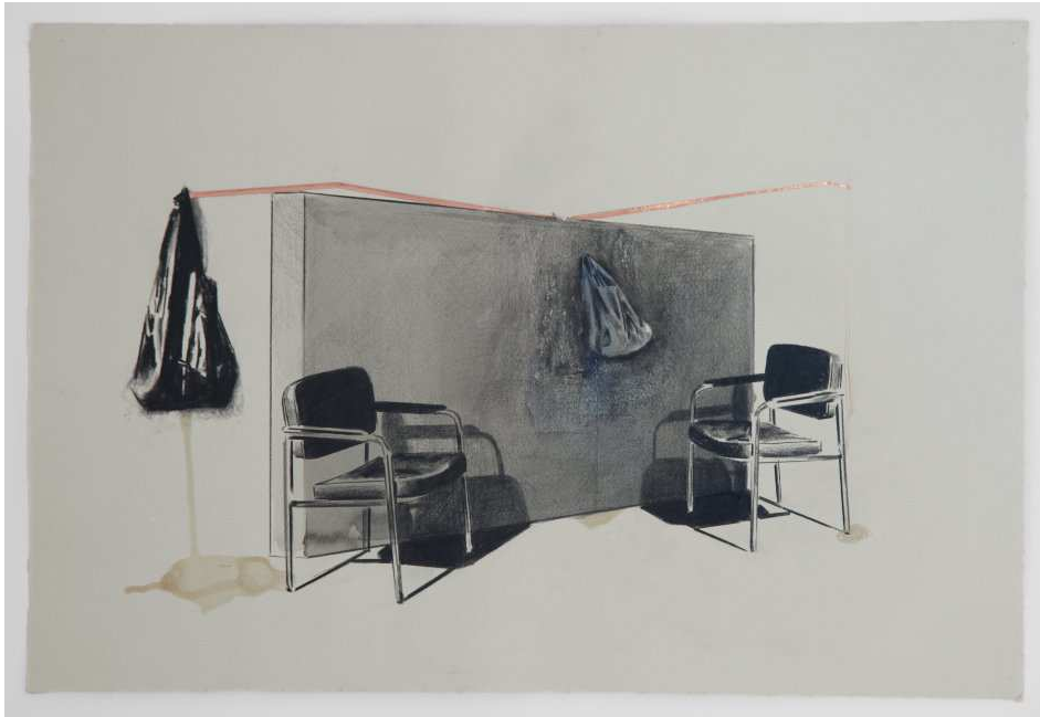
Tatiana Trouvé, Sans titre , 2012. Crayon sur papier, encre de Chine, cuivre, vernis, 38 x 57 cm. Photographie Laurent Edeline. Courtesy Galerie Perrotin, Galerie Gagosian, Galerie König. © adagp.

Au moyen de matériaux simples et quotidiens, Tatiana Trouvé élabore un univers immobile à la fois inquiétant et raffiné. Nourrie d'influences plus littéraires que plastiques, l'artiste renouvelle depuis le milieu des années quatre-vingt-dix le genre et le sens de la sculpture et de l'installation. Ses œuvres, dessins en volumes, sculptures isolées ou véritables espaces architecturés, qu'elle fabrique, tord, soude et assemble, donnent corps à son expérience personnelle de la vie. Lauréate du Prix Marcel Duchamp en 2007, elle est aujourd'hui une figure majeure de la scène artistique internationale.