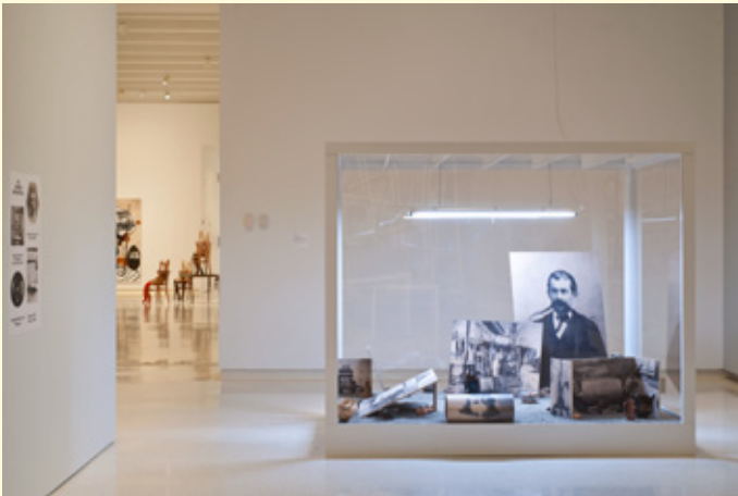
3- Pierre Leguillon, Tifaifai , Fondation nationale des Arts graphiques et plastiques, Paris, 2013. Collection Les Abattoirs, Frac Midi-Pyrénées, Toulouse.