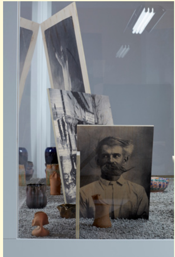
4 et 5- Pierre Leguillon, A Vivarium for George E. Ohr , 2013. Carnegie International, Pittsburgh, USA, 2013.