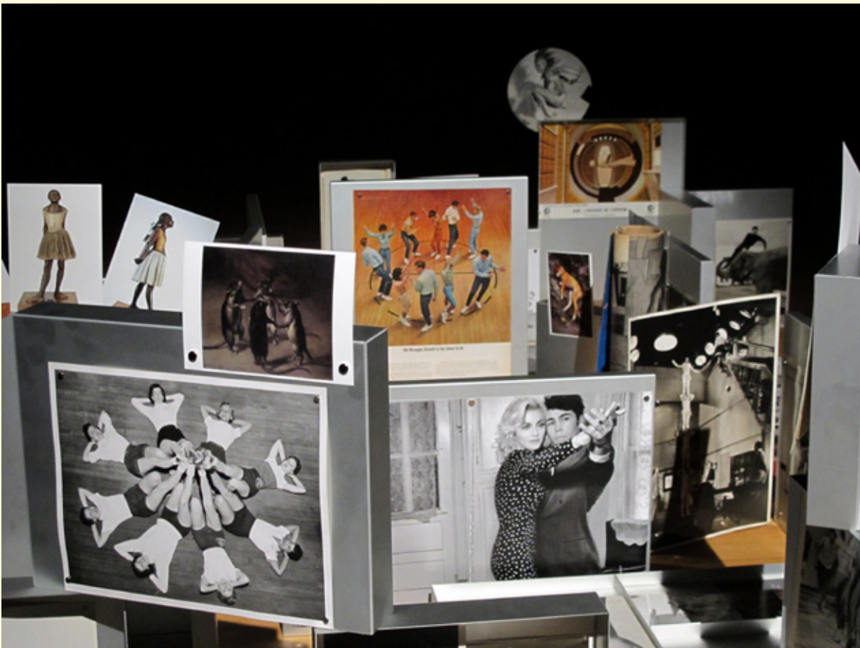
6 et 7- Pierre Leguillon, La grande évasion , Musée de la Danse, Rennes, France, 2012. Collection Musée de la Danse.