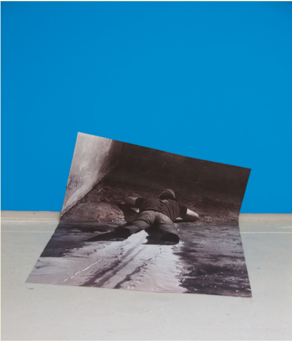
1- Sans titre (Mc Carty) , impression sur papier et encapsulage, 2013.