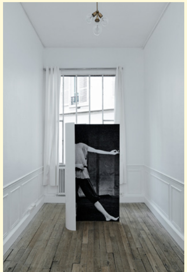
2- Sans titre (Dana) , impression sur papier, aluminium et peinture, 2014. exposition Triangle France.