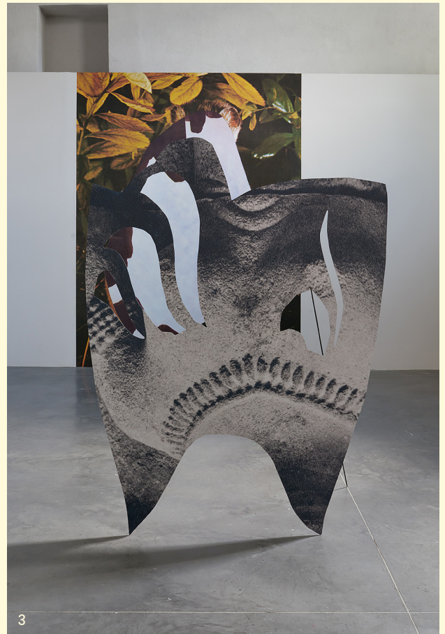
3. Éléonore False, Arrière, plan, copie , 2017. Vue de l'exposition La liberté des liaisons , Les Capucins, centre d'art contemporain d'Embrun.