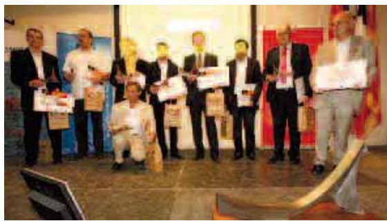
Tous les artisans lauréats du concours 2009 Stars & Métiers du Languedoc-Roussillon, organisé par la Chambre régionale de Métiers et de l'Artisanat

Le Languedoc-Roussillon « possède de réels atouts pour devenir un creuset de développements d'ambition internationale sur certains segments : la valorisation des ressources naturelles, les technologies propres ou encore la santé », affirme le rapport de Thierry Bruhat. « Plusieurs mesures du premier plan d'actions veulent approfondir la dimension internationale, à travers l'export ou la recherche. Comme la création d'un