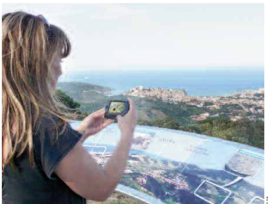
L'innovation s'invite dans le secteur tourisme. À Gruissan, grâce à son smart phone, on peut désormais consulter un véritable guide touristique de la station.

Bonne illustration de cette culture de l'innovation : Réseau Innov'Action LR, le club des artisans innovants né lors de la Journée de l'innovation artisanale