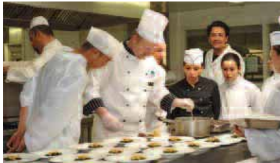
L'univers « agrolimentaire, alimentation, cuisine » accueille le 2e effectif d'apprentis de la région (1 662 en janvier 2009), juste derrière le commerce et la vente (1 802).

La formation reste une excellente réponse à la crise. C'est pourquoi la Région vient de revaloriser les indemnités compensatrices forfaitaires (ICF) et augmente de 6 millions le budget « apprentissage » en 2009, le portant à 78,5 millions d'euros. Cet effort se concrétise par la hausse de 80 % de l'aide à la signature d'un contrat d'apprentissage et de 20 % de l'aide à l'embauche d'un apprenti en CDI (lire encadré). De quoi mobiliser les entreprises, confrontées « à une crise de confiance », note Pierre Brunel, président du Medef L.-R. Si 15 025 apprentis travaillent dans les entreprises régionales au 1 er janvier 2009, leur nombre n'a augmenté que de 1,88 %, alors que les signatures de contrats progressaient depuis 2005 de plus de 5 % tous les ans. Or, l'objectif de la