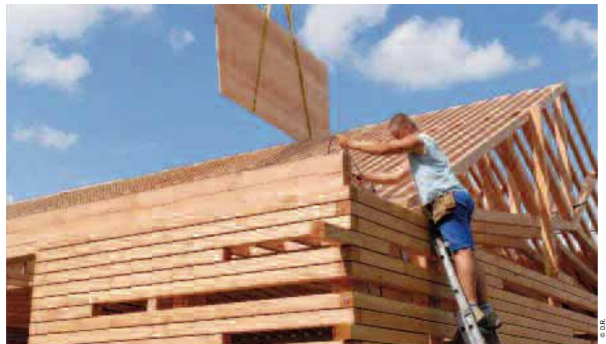
Le marché du bois construction connaît un fort développement en région, tout comme celui du bois énergie.

L'objectif est d'aboutir, d'ici au début 2010, à la signature d'un contrat triennal avec la Région et l'État. Après un premier comité de pilotage qui a mobilisé 40 acteurs début juillet, des groupes de travail ont planché en septembre sur un diagnostic économique (confié par la Région à l'Insee), sur un « plan de mobilisation » des zones prioritaires d'exploitation forestière, la définition des objectifs du contrat de filière, ainsi que sur « la formation et l'innovation, à laquelle la Région et